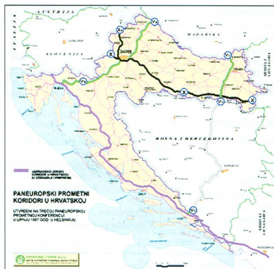
Slika 2. Dio trase Jadransko-jonske autoceste u Hrvatskoj

Za Hrvatsku bi JJAC bio projekt od izvanredne važnosti jer bi povećao značenje cestovnih pravaca koje Hrvatska gradi odnosno još planira izgraditi. Iako su cestovni pravci