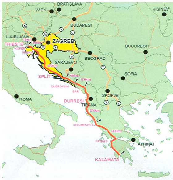
Slika 1. Jadransko-jonska autoceste u europskoj mreži autocesta

Trasa Jadransko-jonske autoceste (JJAC) međunarodnih oznaka E-61, E-65 i E-80 (Trst – Rijeka – Zadar – Split – Dubrovnik – Bar – Drač – Atena) položena je uz istočnu obalu Jadrana i Jonskog mora – od Trsta u Italiji do Igoumenitse u Grčkoj, u ukupnoj dužini od približno 1100 km. Prolazi kroz 7 zemalja: Italiju (10 km), Sloveniju (30 km), Hrvatsku (460 km), Bosnu i Hercegovinu (90 km), Srbiju